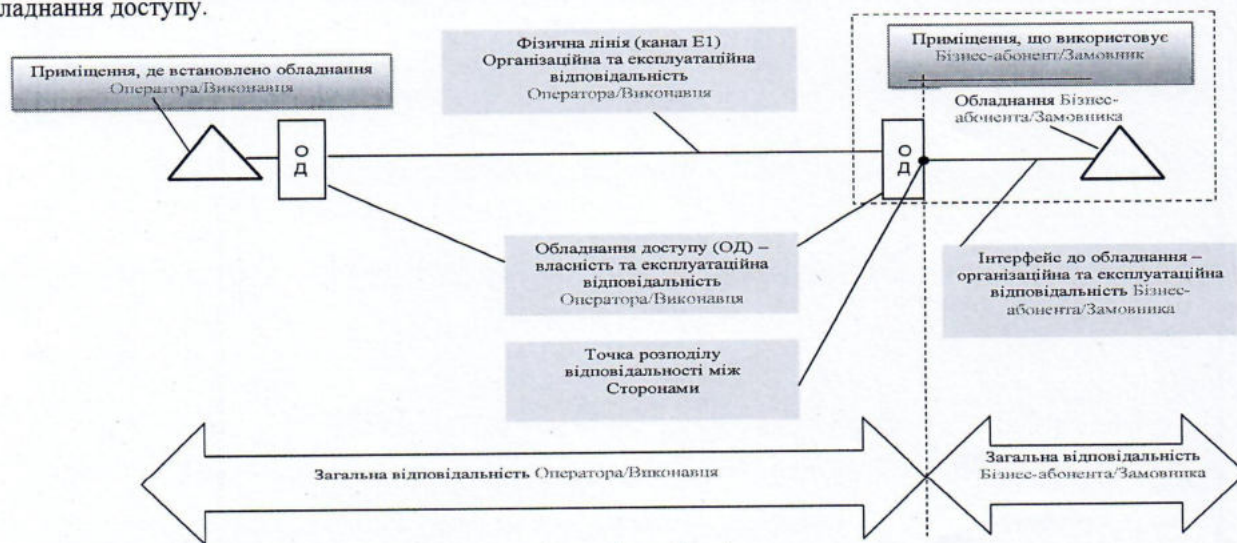
Рис. Конфігурація обладнання та відповідальність Сторін

Виконавець встановлює обладнання доступу в приміщенні, в якому надаються Послуги ISDN PRI, та забезпечує його технічне обслуговування. Обладнання доступу залишається власністю Виконавця. Замовник надає Виконавцю місце для встановлення обладнання доступу, забезпечує його заземленням до 4 Ом та гарантованим живленням 220В. Приміщення Замовника повинно відповідати усім вимогам технічної експлуатації відповідного обладнання доступу.